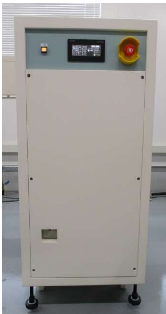
外形図 ※CW-120-Nの参考図となります